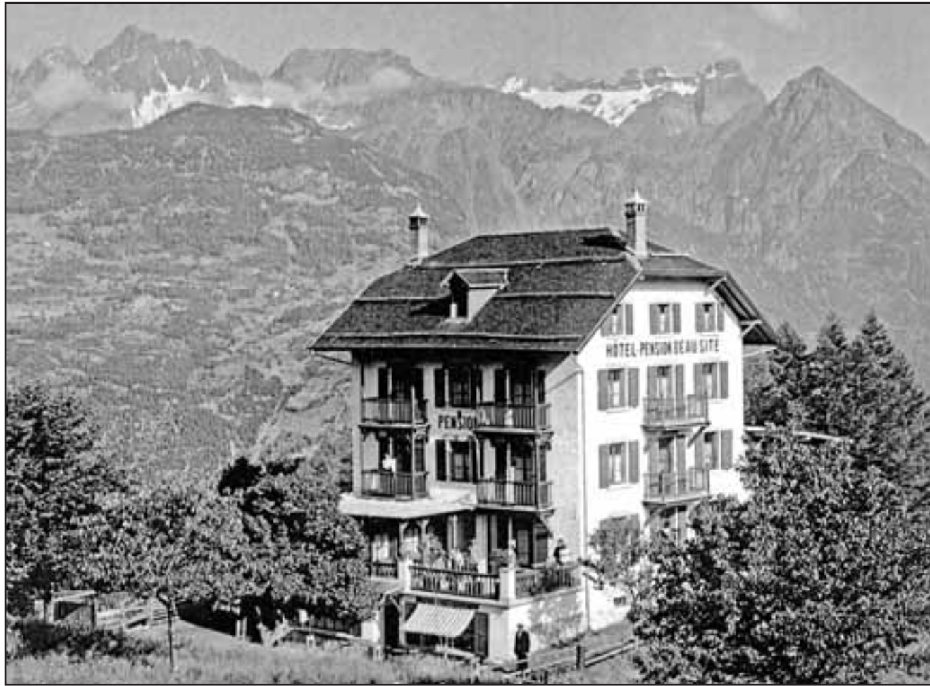
Le Beau-Site en pleine jeunesse, photographié entre 1912 et 1922. LDD

A pied. Environ deux heures à travers la forêt. Partir du parcours Vita de Martigny-Croix. Suivre les panneaux jaunes des sentiers pédestres. Renseignements: www.chemin.ch