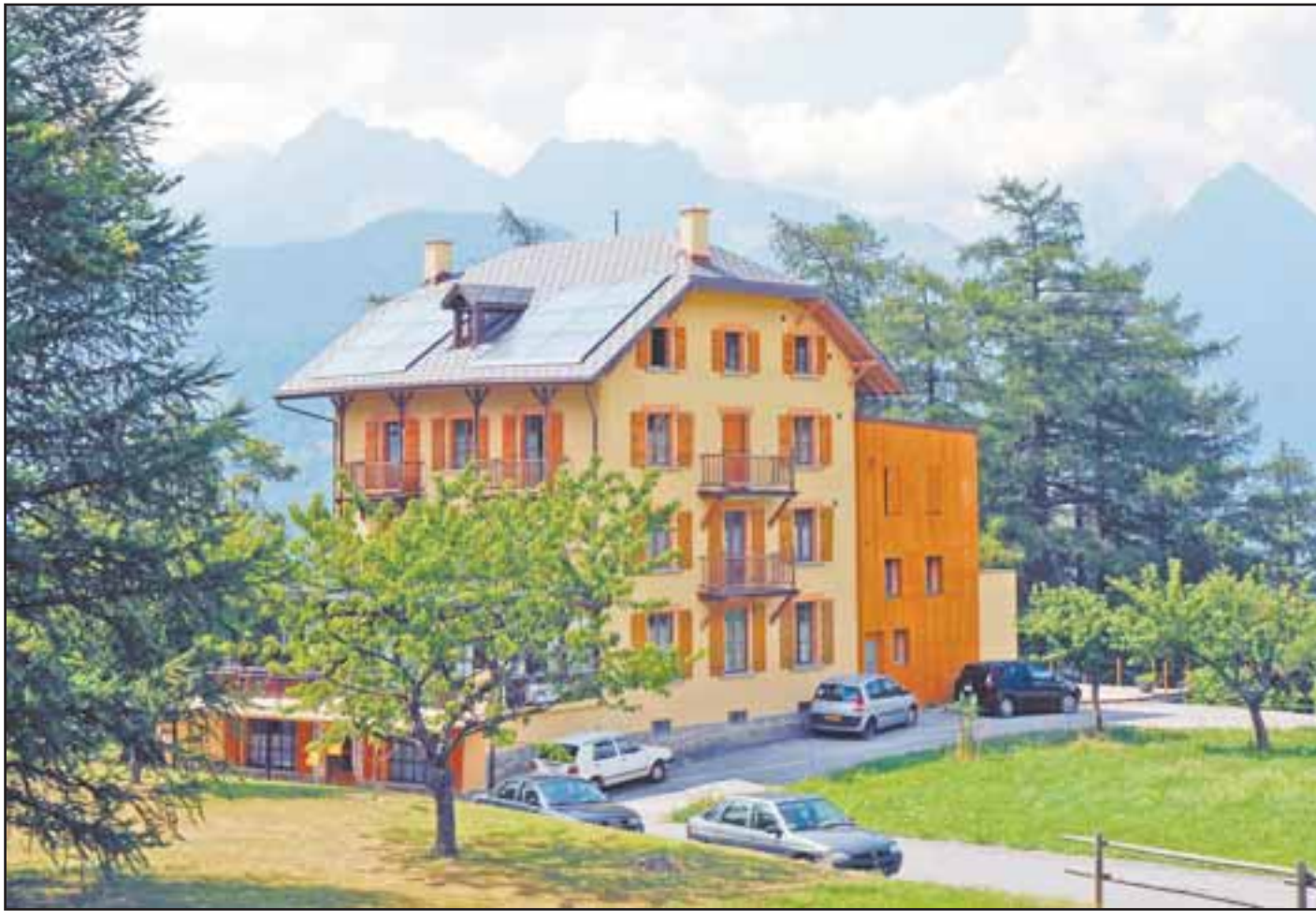
Le Beau-Site aujourd'hui. Toujours le même charme nonobstant son annexe récemment reconstruite. HOFMANN

c'est aujourd'hui à la fois un havre de paix et un modèle écologique.